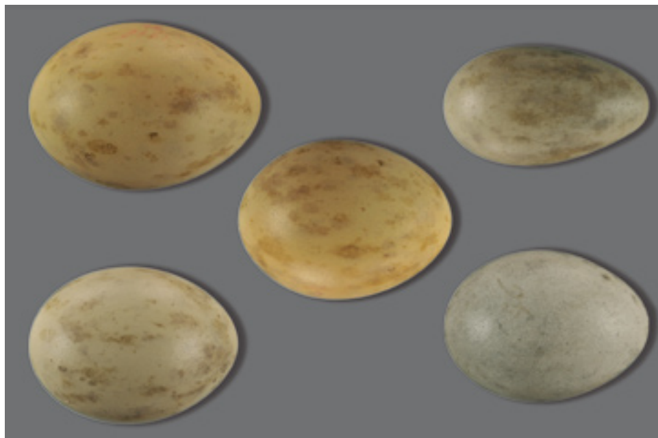
Fot. 1. Jaja dropi Otis tarda z terenu Wielkopolski. The Great Bustard Otis tarda eggs from Wielkopolska

Rysunek. Jaja pokryte były zwykle dużymi plamami o nieregularnych kształtach i ostrych brzegach plam. Niekiedy plamy skupiały się i tworzyły duże namazy lub koncentrowały się w tępych bieguniu. Trafiły się także jaja z drobnymi plamkami w postaci długich sznurów lub prawie pozbawione plam. Plamkowanie głębokie było zazwyczaj obfite, a w przypadku nielicznych plam powierzchniowych, plamy głębokie dominowały na skorupce.